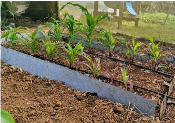
Plantas de maíz en suelo abonado SIN Biocarbón

Estudios comparativos en condiciones equivalentes