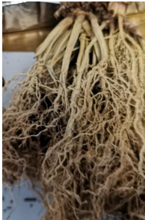
Raíces de planta en suelo TRATADO con biocarbón