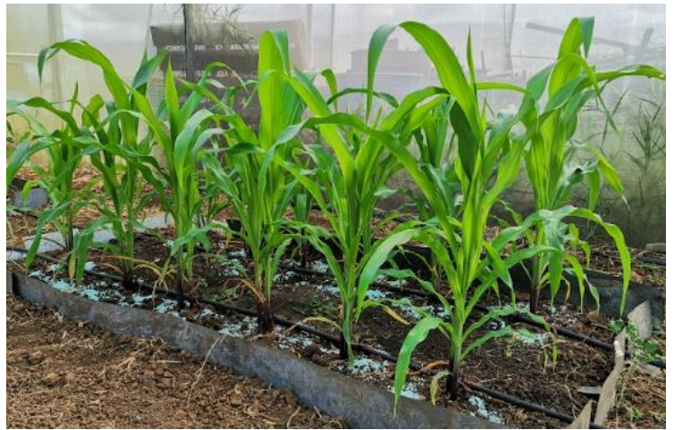
Plantas de maíz en suelo abonado y TRATADO con Biocarbón